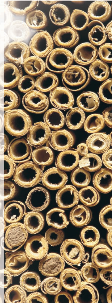
INSEKTENHOTEL AUS SCHILFRÖHRCHEN

WAS KANN MAN NOCH TUN, UM SOLITÄRE INSEKTEN ZU SCHÜTZEN?