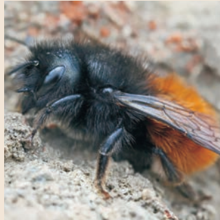
GEHÖRNTÉ MAUERBIENE (OSMIA CORNUTA)

Im Insektenhotel sind auch viele Grabwespenarten nachweisbar. In Deutschland sind 263 Arten bekannt, von denen viele im Bestand bedroht sind. Anders als die Solitärbiene tragen sie keinen Blütenstaub oder Nektar ein, sondern durch einen Stich gelähmte Insektenlarven oder Spinnen, von denen sich die geschlüpften Grabwespenlarven ernähren.